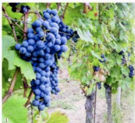
1. Un grappolo di Uva Dolcetto 2. Immagine promozionale del Gavi e del suo territorio 3. Il grignolino del Monferrato 4. Il Timorasso al Vinitaly edizione 2018